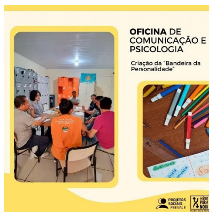
Figura 1: Post na rede social Instagram sobre uma oficina

Organizadas em sistemas de encontros semanais com dias fixos, cada área de agrupa de acordo com o plano semestral das oficinas, possibilitando estar em atividades no Centro Pop ou na universidade Feevale, principalmente, nos dias de gravação dos podcasts.