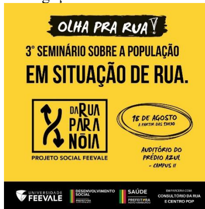
Figura 2: Divulgação do Seminário “Olha pra Rua!”